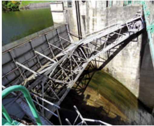
Vanne centrale du barrage de Poutès