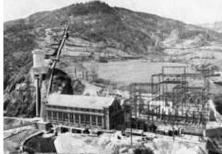
L'usine de Monistrol dans les années 40