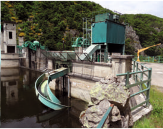
L'ascenseur et le toboggan pour la montaison du saumon