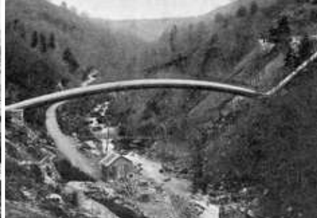
Construction du pont siphon