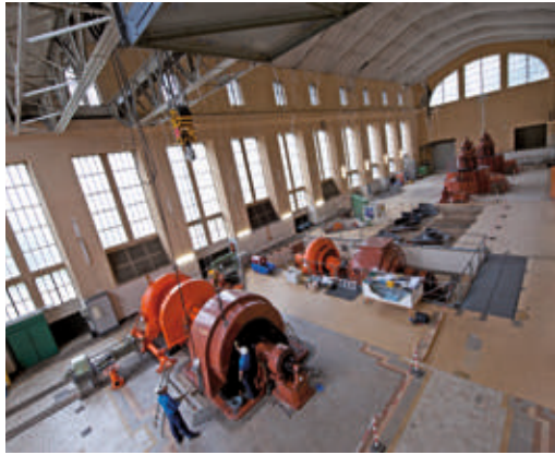
Intervention sur un groupe horizontal de la chute Ance du Sud