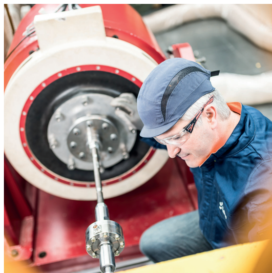
Pot vibrant simulant le chargement sismique