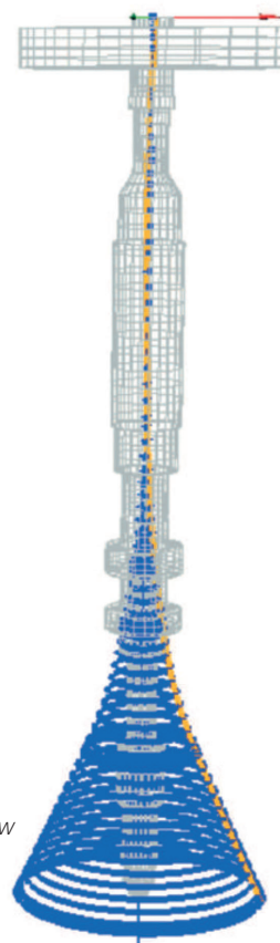
GMPP 900 MW